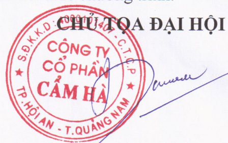
Nguyễn Chí Dũng